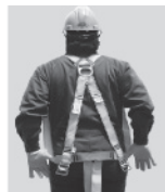
3. Colóquese el arnés como si fuera un chaleco; la anilla "D" debe quedar en la espalda y al centro de los hombros.