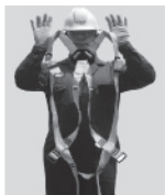
2. Sostenga el arnés de las correas de los hombros.