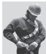
3. Abroche las hebillas que cuelgan a la altura de las piernas y proceda a regular.