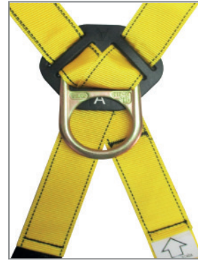
VISTA POSTERIOR ANILLA DORSAL