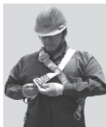
2. Abroche la hebilla que está a la altura de la cadera.