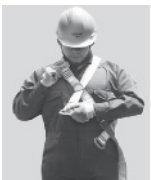
1. Abroche la hebilla que queda a la altura del pecho.