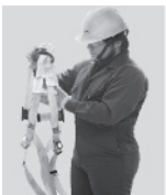
1. Tómelo de la anilla "D" que se encuentra entre las etiquetas de marca y las instrucciones