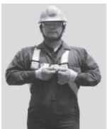
1. Abroche la hebilla que queda a la altura del pecho.