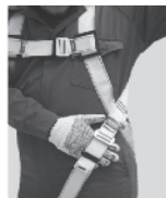
3. Regule todas las hebillas de tal forma que quepa una mano apretada entre la ropa y las correas.