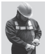
2. Abroche las correas que cuelgan a la altura de las piernas.